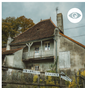
TOUR DE BOURDEAU